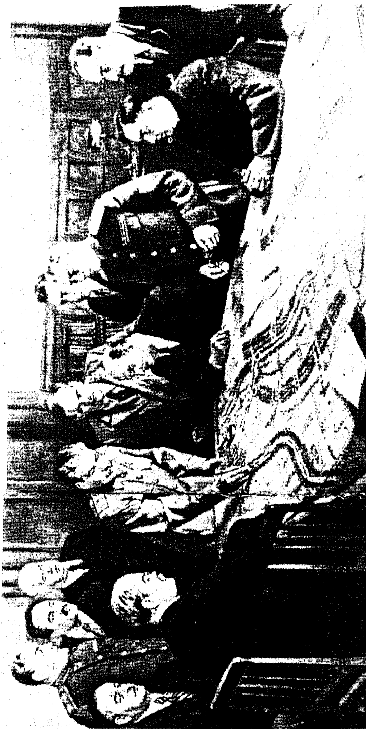
ستالين قائد مكتبي: كان ستالين يحب فرش الخرائط العسكرية على الطاولة الكبيرة في مكتبه لمتابعة سير المعارك. ويرى من حوله كبار القادة والمسؤولين.